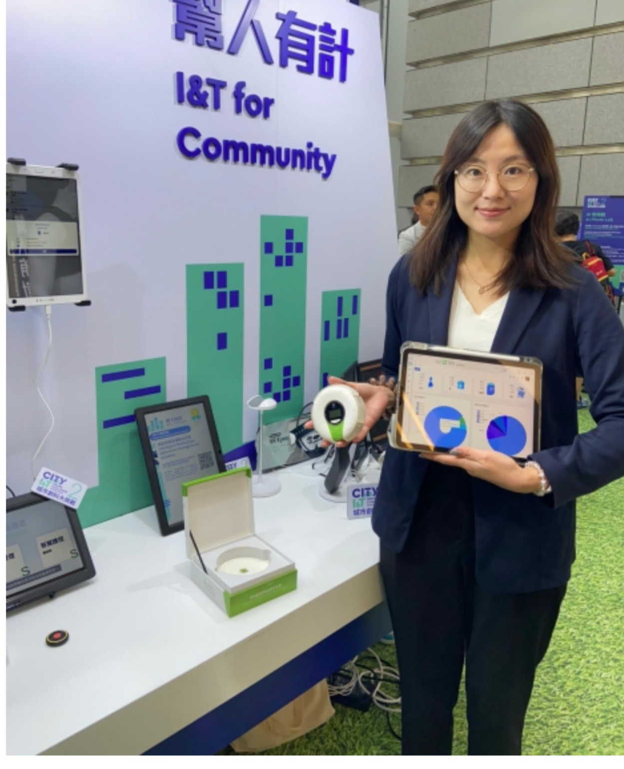
智能用藥管理解決方案靈感來自團隊一名成員的外婆的用藥經驗。