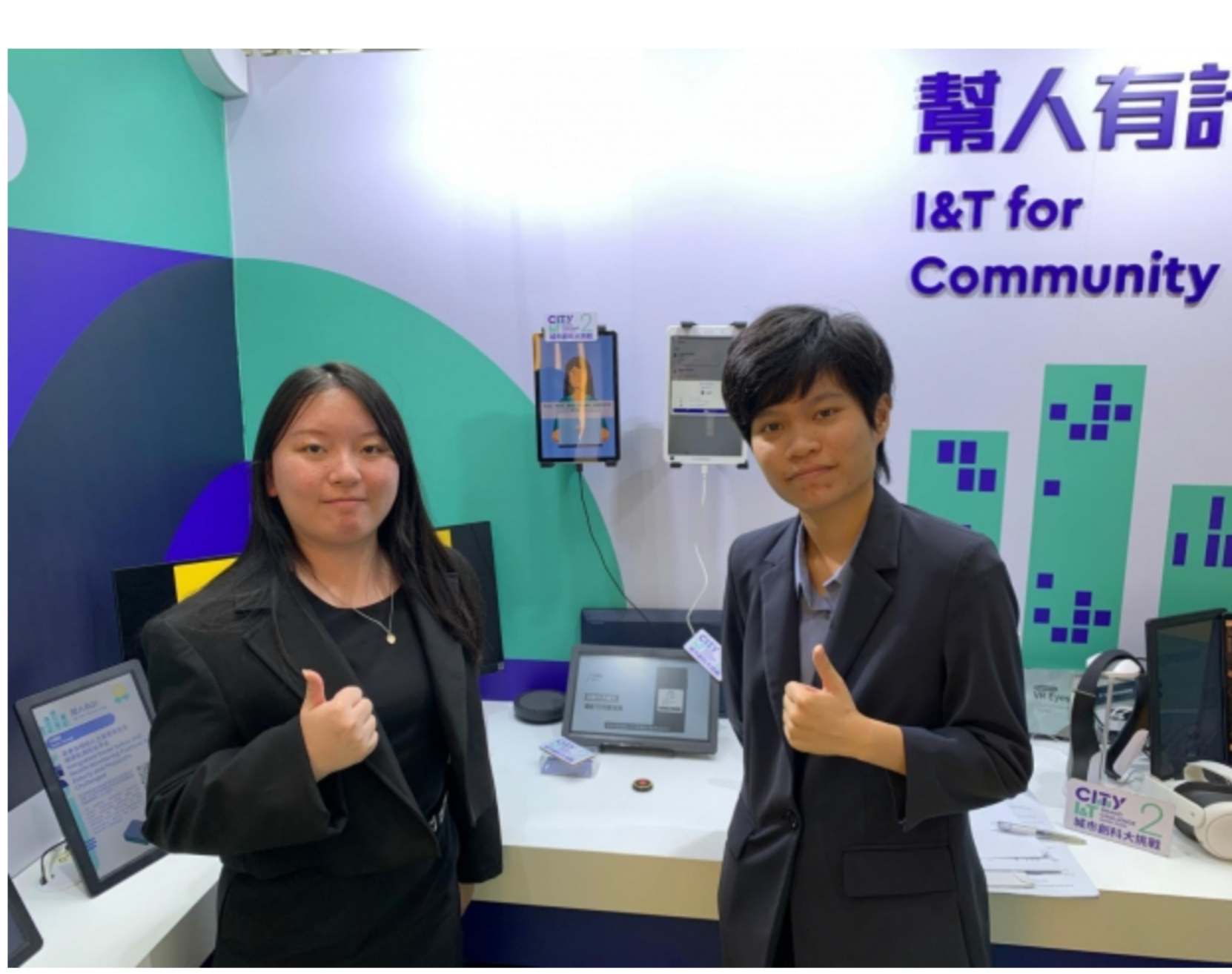
Saferin智護老構思源自一份課堂習作。