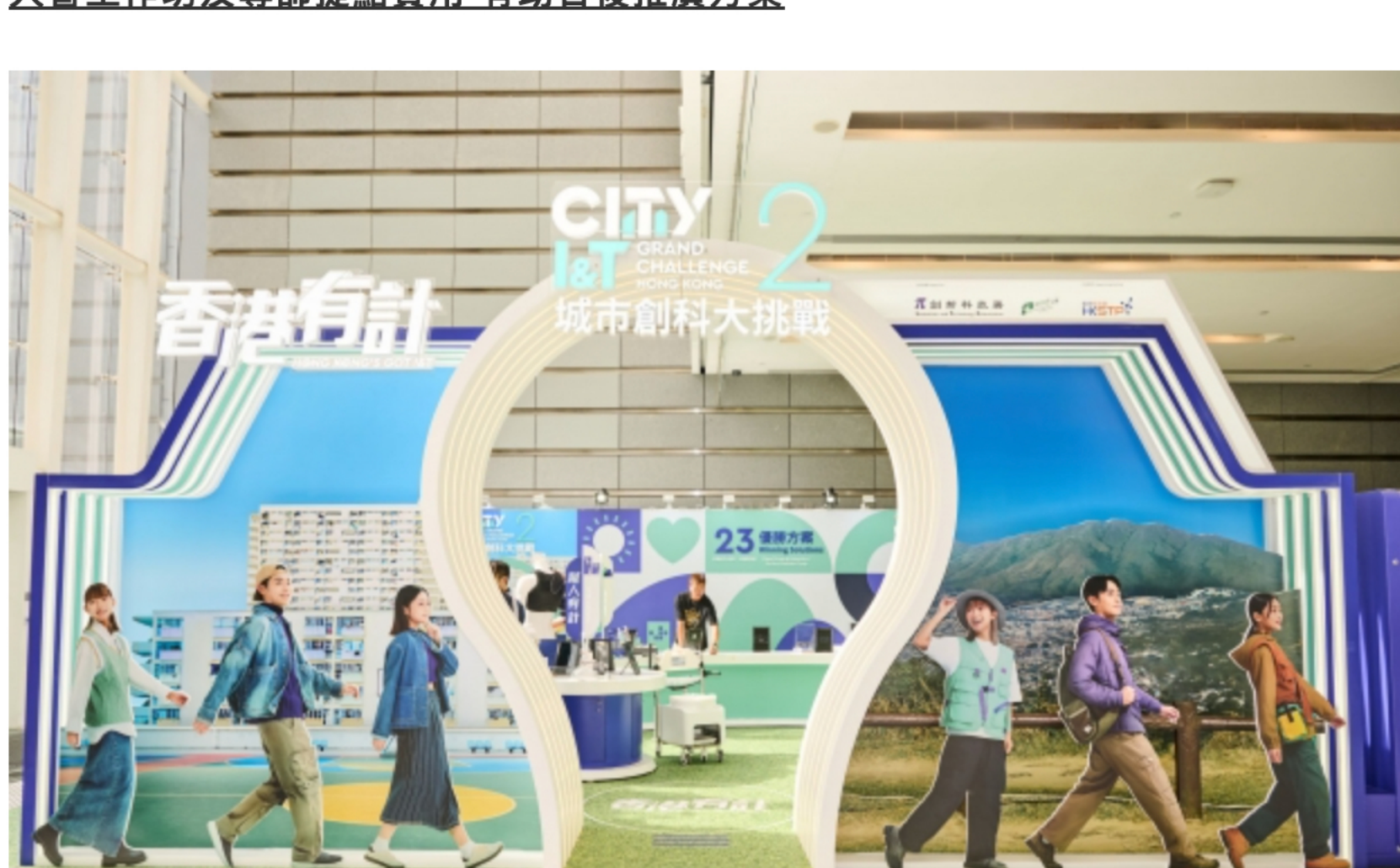
大會為參賽者提供工作坊及導師指導，協助參加者完善產品和提升演說技巧。