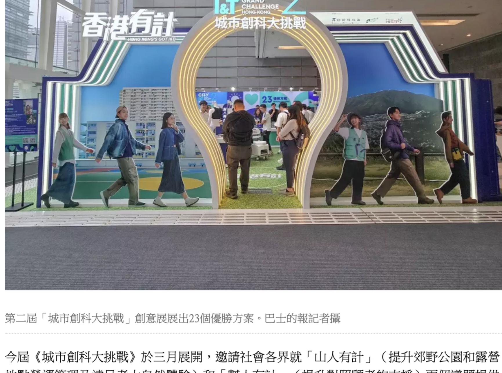
第二屆「城市創科大挑戰」創意展展出23個優勝方案。

第二屆《城市創科大挑戰》創意展的23個優勝方案中，「山人有計」公開組的「Sage Chatbot應用程式（App）」，以及大學/大專院校組的「綠遊易NFC柱」，不約而同可離線運作作為研發焦點，更適合在郊野地區應用。