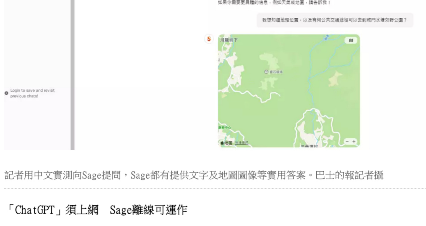
記者用中文實測向Sage提問，Sage都有提供文字及地圖圖像等實用答案。

現時Sage Chatbot可支援逾20種語言，包括中文、英文、法文及日文等，並免費提供網站版本給市民及遊客使用，記者用中文實測向Sage提問，Sage都有提供文字及地圖圖像等實用答案。隨著繼續改良及優化Sage，Samuel預計Sage的iOS及Android版App將於2025年下半年面世。