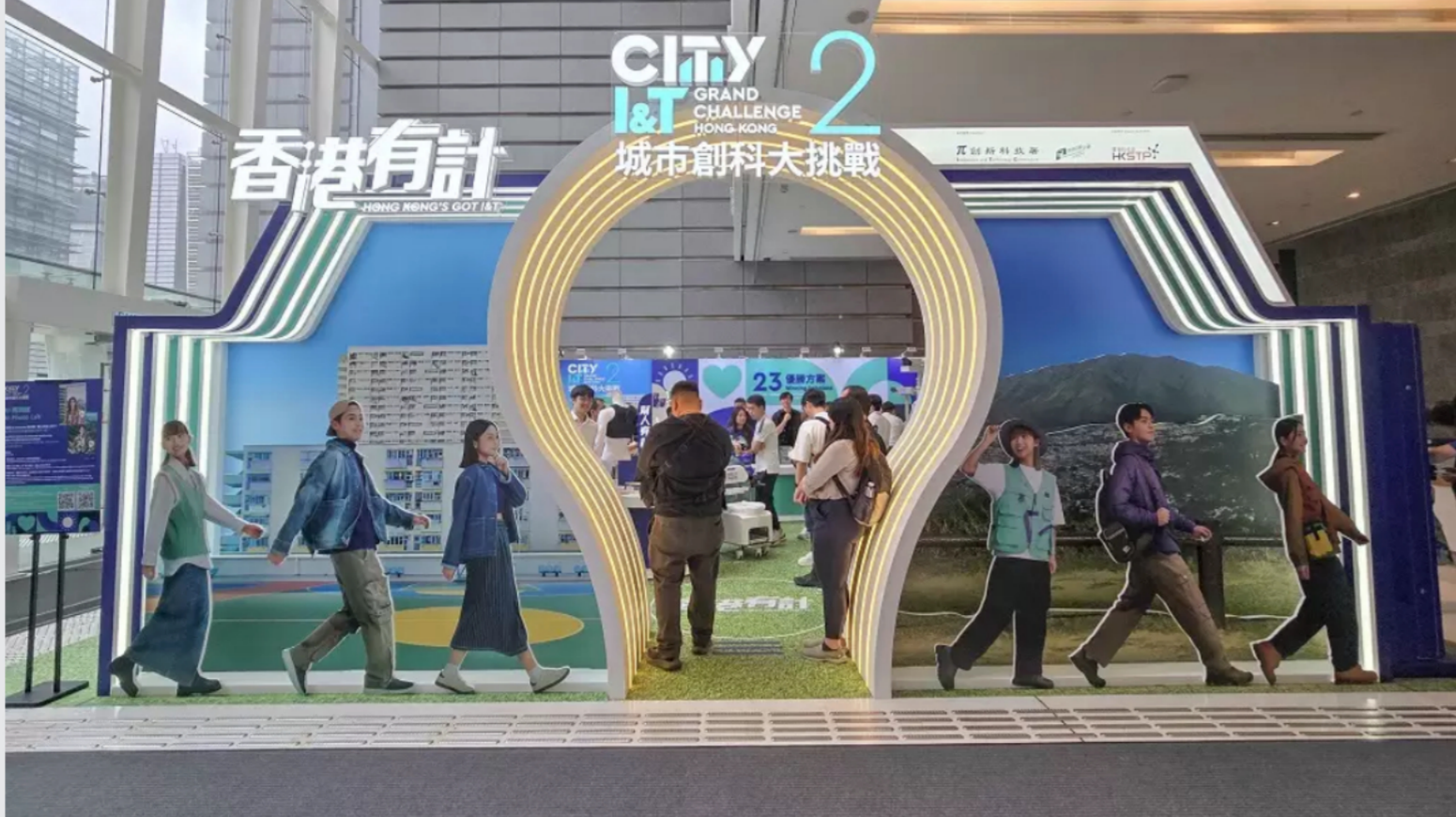
第二屆「城市創科大挑戰」創意展展出23個優勝方案。