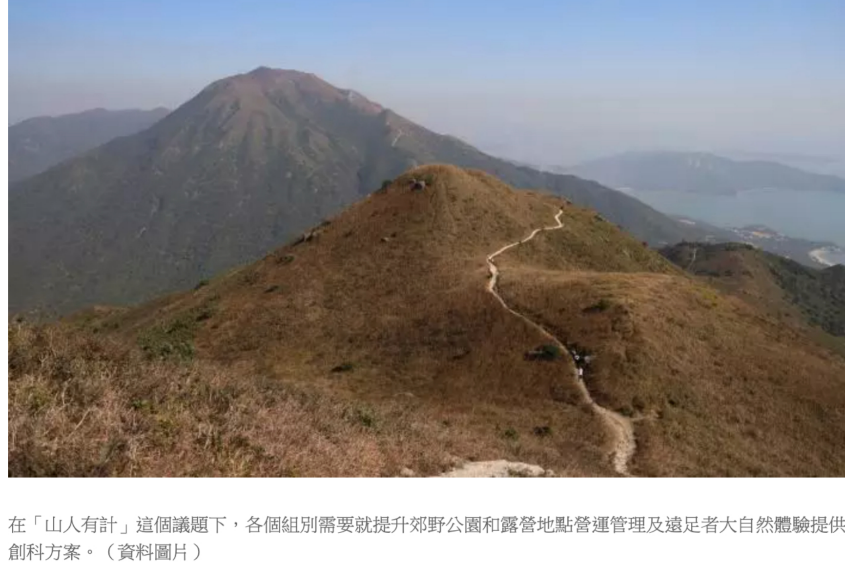
在「山人有計」這個議題下，各個組別需要就提升郊野公園和露營地點營運管理以及遠足者大自然體驗提供創科方案。（資料圖片）