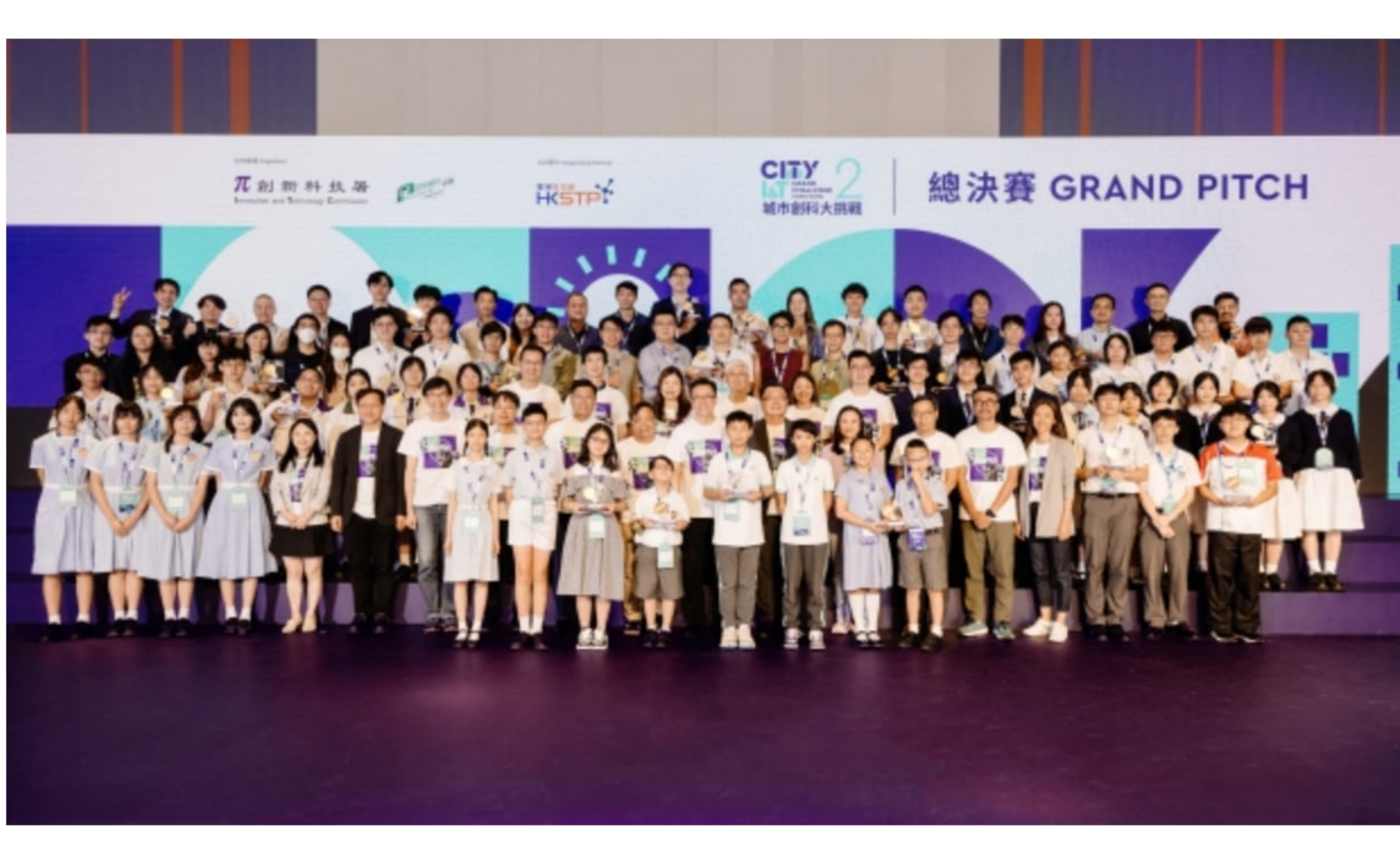
第二屆《城市創科大挑戰》總決賽日前於香港科學園順利舉行，各嘉賓與優勝者合照。

由創新科技署主辦、香港科技園公司為合辦夥伴的 第二屆《城市創科大挑戰》 總決賽，日前於香港科學園順利舉行。比賽吸引一眾科技愛好者、業界代表和市民參與。作為創科界盛事之一，這次比賽不僅展示了新一代創科人才的卓越表現，更讓大眾體會到科技改變生活的無限潛力。