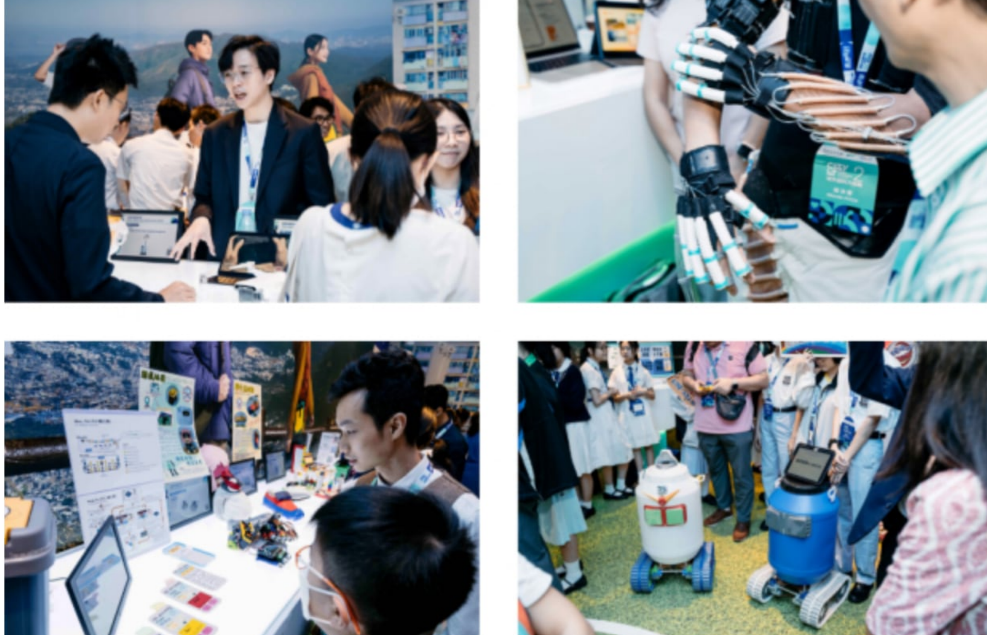
27支入圍總決賽隊伍向公眾展示和介紹方案，供現場觀眾一人一票選出各個組別的「最喜愛獎」。

第二屆《城市創科大挑戰》總決賽畫上圓滿句號，而各個優勝者將積極借助比賽資源優化方案，做好準備向公眾展示方案原型和分享試用成果。今屆優勝者表示，大會為他們提供了一系列培訓和工作坊，賽後更有機會和資源實踐創新方案，讓創意得以落實，並期望這些方案能夠惠及公眾。這次比賽無疑是一個展示創新實力的平台，期望有更多創新科技走出社會，走向世界，助力城市的進一步發展。