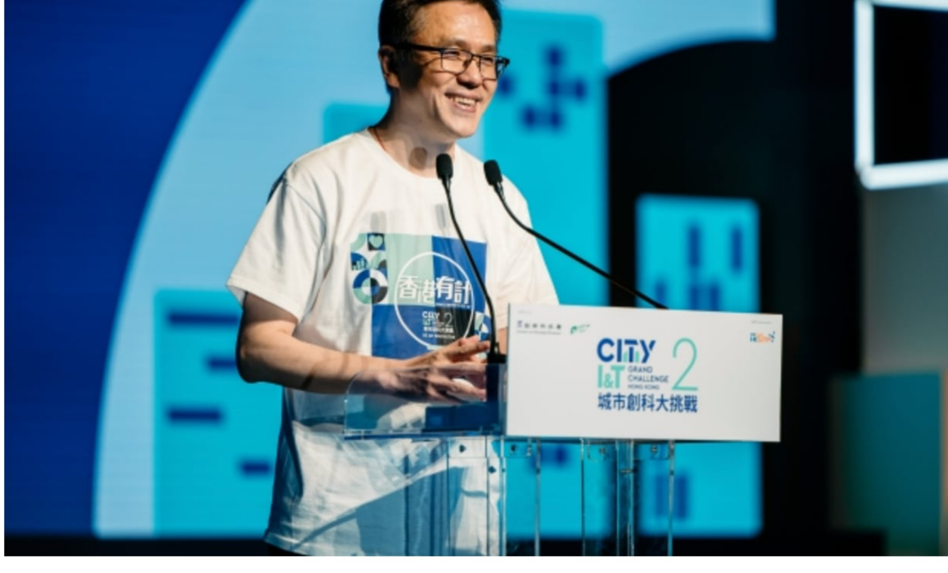
創新科技及工業局局長孫東教授鼓勵參賽者繼續積極為香港的創科發展「諗計、度計」。

創新科技及工業局局長孫東教授致辭時表示，這次活動不僅是一場比賽，更是一個推廣全民普及及發掘和培養創新人才的絕佳機會。香港現正全力推動成為國際創新科技中心，而人才是創科發展的核心，因為『有人就有計』。他對參賽者在創新科技領域的熱忱和對社區的關懷表示高度肯定，並希望他們能夠繼續保持「滿腦計仔」，積極為香港的創科發展「諗計、度計」。