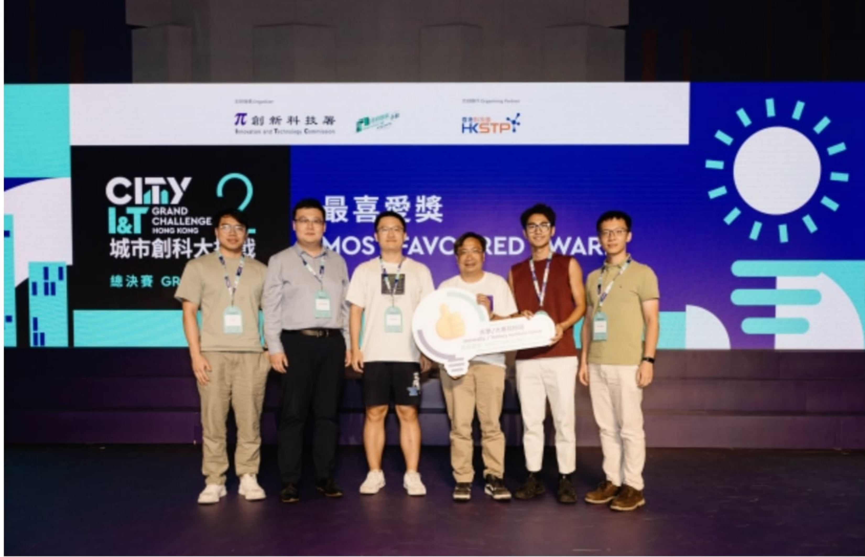
創新科技署署長李國彬頒發大學／大專院校組的「最喜愛獎」。

創新科技署署長李國彬亦提到，《城市創科大挑戰》旨在推動應用創新科技解決社會問題。今年比賽反應熱烈，參賽人數是上屆的近兩倍。